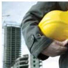
مشروع إسكان جبل علي للعمال