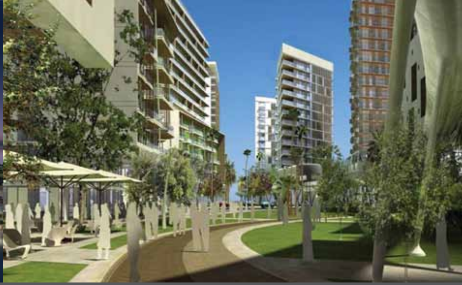
مشروع تطوير وسط جدة

لإيجاد بيئة جديدة تتميز بالبنية التحتية المتطورة والمرافق العصرية والطرز المعماري الحديث الذي يعكس اعزاز المدينة بتراثها العريق ومساحاتها العامة الخضراء، بما يدعم مساعي مدينة جدة في تعزيز اقتصاد قوي جديد. وقد حصل المخطط الرئيسي على موافقة ومباركة خادم الحرمين الشريفين الملك عبد الله بن عبدالعزيز آل سعود حفظه الله ورعاه، مع تعيين شركة سيتي سنتر للتطوير رسمياً لتكون المطور الرئيسي للمشروع.