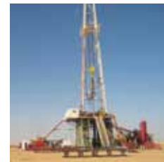
شركة تشانلنجر ليمتد