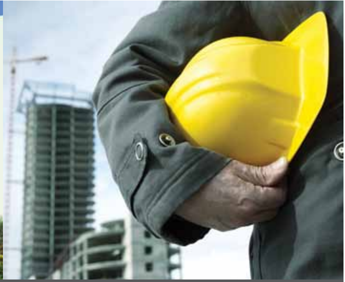
مشروع إسكان جبل علي للعمال