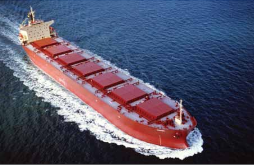
شركة ليمسولر للملاحة والسفن