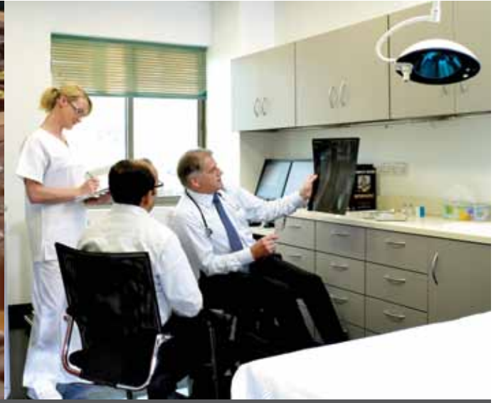
المستشفى الألماني للعظام