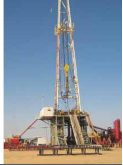
شركة تشالنجر ليمتد