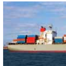
شركة لميسولر للملاحة والسفن