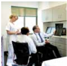
المستشفى الألماني للعظام