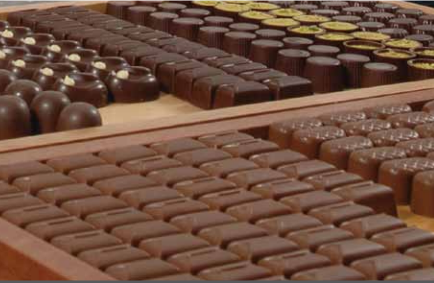
شركة الشوكولاته دتش دلایت