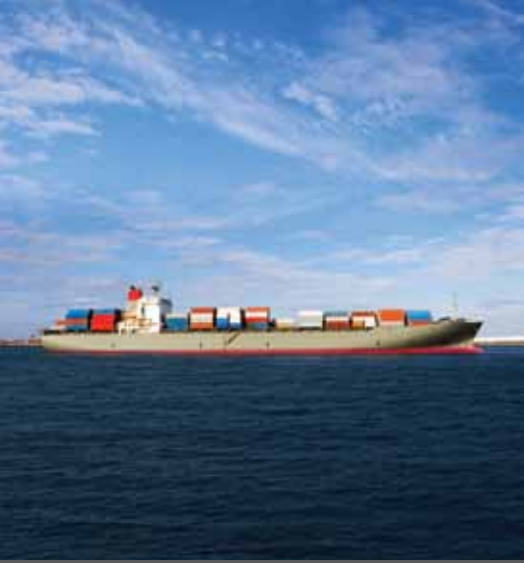
شركة ليمسولر للملاحة والسفن