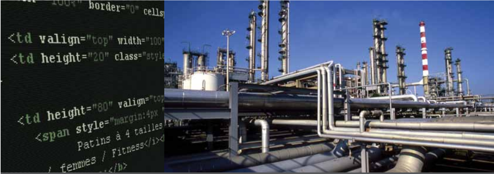
شركة آي تي ووركس