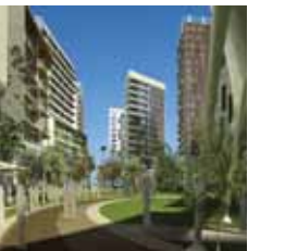
شركة فينشر كابيتال السعودية الاستثمارية